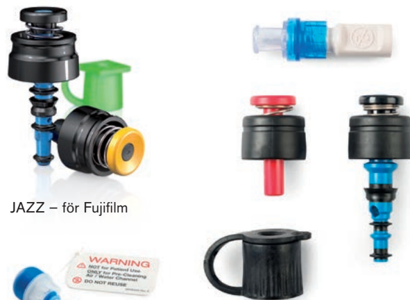
JAZZ – för Fujifilm

Till BioGuard finns även en spol/rengöringsknapp som är separat förpackad eller förpackad med knapparna.